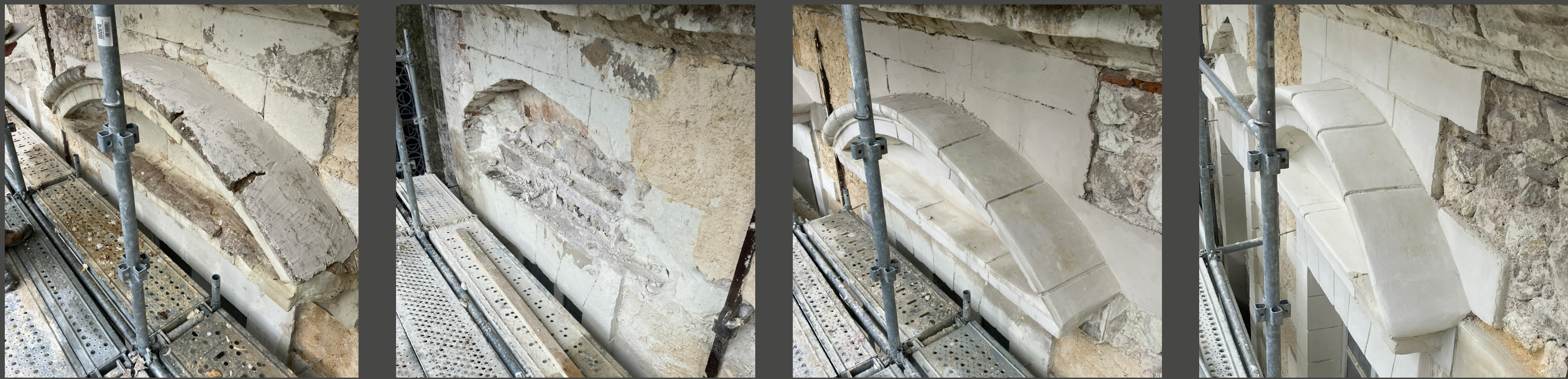
Étapes de rénovation des frontons

Dans le cadre de la mise en valeur du patrimoine architectural de Beaugency, Le Grand Hôtel de L'Abbaye engage des travaux de rénovation des façades sud et ouest. Ces interventions ont pour objectif de restituer les éléments de décor architecturaux d'origine retrouvés au cours de la campagne de ravalement réalisée avec l'Inrap en Novembre 2022.